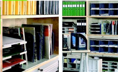
La clasificación inteligente. Ahorra tiempo y espacio