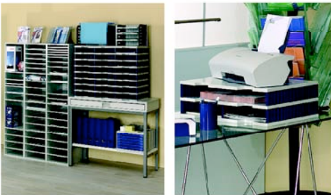
Máxima capacidad de ampliación